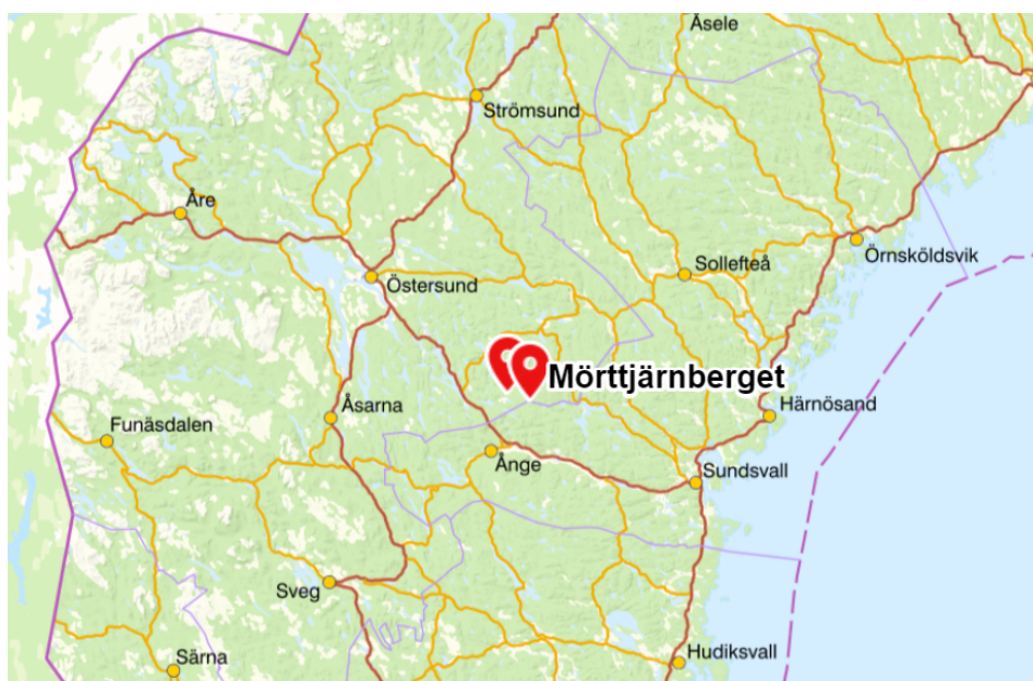
Figur 2. Karta över elnätets geografiska lokalisering.

Figur 2 visar en mer utzoomad bild på området för att ge läsaren en bättre överblick över i vilken del av landet företagens elnät finns.